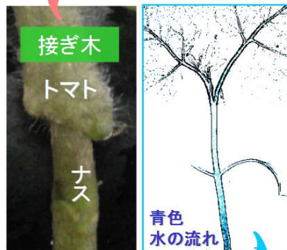
トマト茎内部の水の流れ